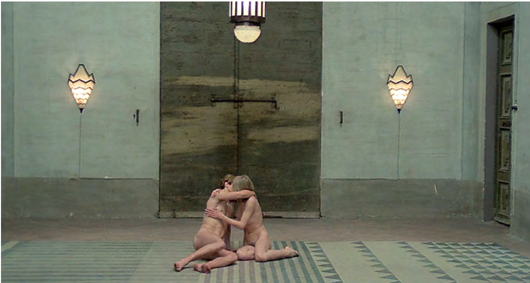
↑ → Salò o le 120 giornate di Sodoma de Pier Paolo Pasolini (1976) → Léda et le cygne de Susan Silas (2019)