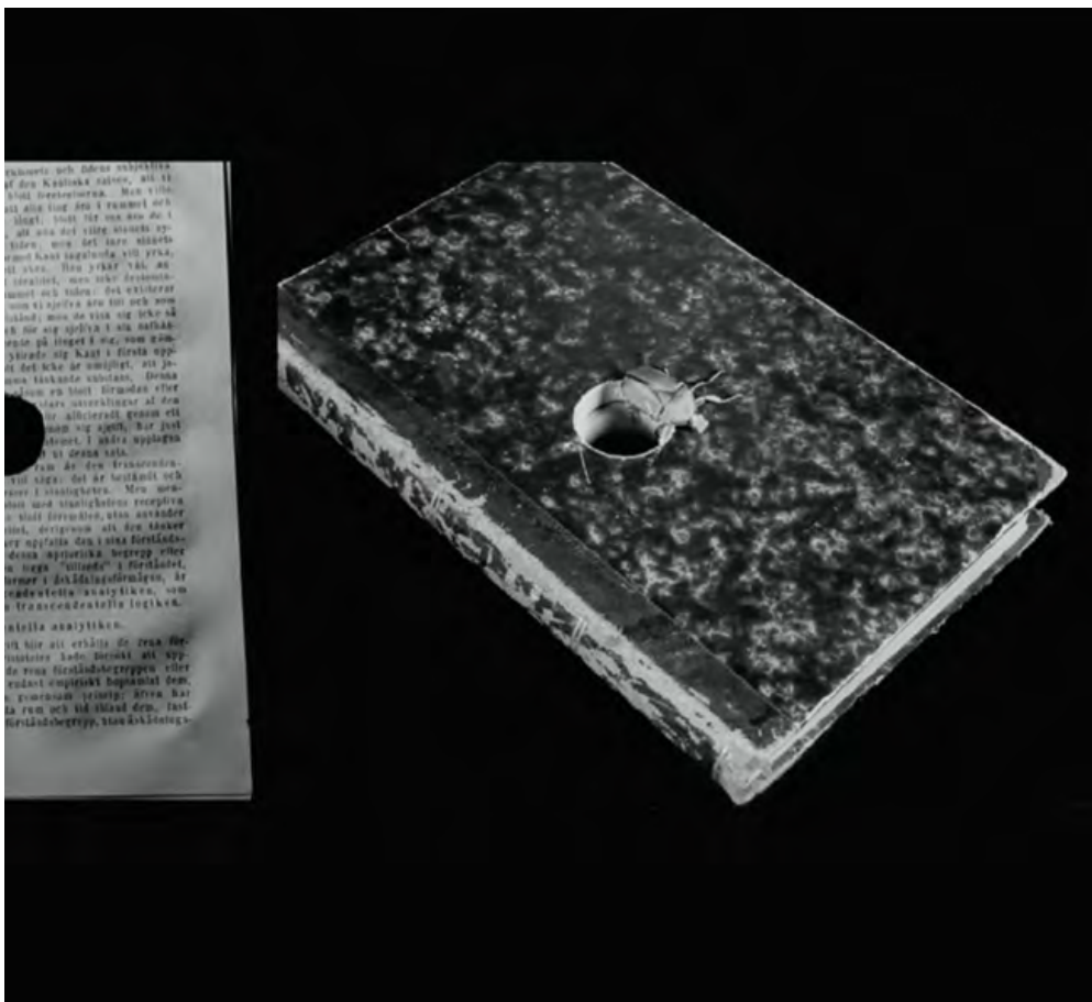
↑ Biblion de Saara Ekström & Eero Tammi (2019, Finlande)

Que se passe-t-il quand l'exposition se déroule en l'absence de tout public, à huis clos ? Cette situation insolite s'est produite à la Friche de la Belle de Mai à Marseille dans le cadre de la 33 e édition du festival Les Instants Vidéo : une exposition invisible d'un art visuel s'est tenue du 12 novembre 2020 au 14 mars 2021. Un événement insolite coproduit par un Célèbre Agent Infectieux, un C.A.I. aussi secret que la C.I.A. Tous les deux ne se révèlent que par leurs effets sur l'ordre du monde.